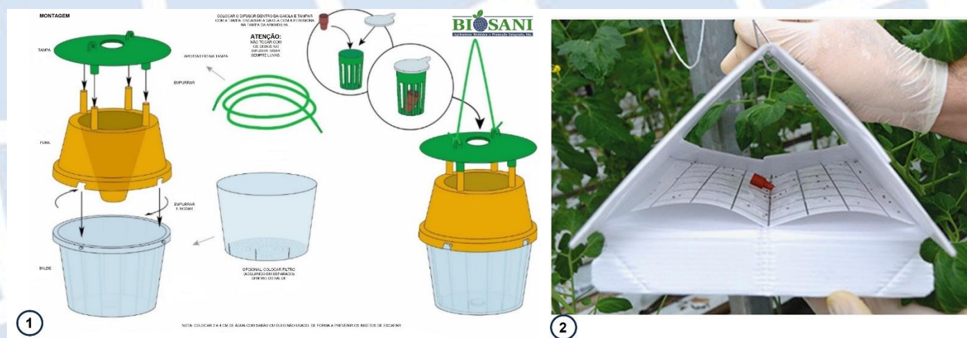
Figura 11.1 - Instruções de montagem do difusor na armadilha de funil (1) e na armadilha delta (2). O tubo de polietileno (Fig. 10.1) deve ser instalado na mesma posição que o difusor de borracha vermelha que se encontra ilustrado na Fig.11.1 (imagem 1 e 2), mas em posição vertical e com a tampa para cima.

11 - Armadilha: Aconselha-se o uso da armadilha de funil (ver figura 11.1.1) ou delta (ver figura 11.1.2) para a captura deste inseto. Instalar as armadilhas nas árvores, à altura onde se espera que o inseto atue. A armadilha de funil aconselhada é a com tampa verde, funil verde e copo transparente, no entanto, poderá utilizar outras combinações, tal como a apresentada na figura 11.1. Alertamos que o amarelo poderá atrair abelhas.