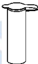
Figura 10.1 - Tubo de polietileno permeável contendo as feromonas. A tampa não deve ser aberta e o tubo deve ser instalado na vertical e com a tampa para cima, tal como apresentado na imagem.

10 - Montagem do dispensador da feromona: Não toque com o dispensador da feromona noutros objetos e use sempre luvas para manipular a feromona. O dispensador / difusor deve ser colocado em posição vertical dentro da gaiola que acompanha a armadilha de funil. Não perfure ou danifique o difusor de feromonas. De forma que o difusor possa manter a sua eficiência durante o período de vida indicado é muito importante que a tampa seja mantida sempre fechada , tal como se ilustra na figura 10.1. O tubo é permeável e permite a difusão gradual do conteúdo.