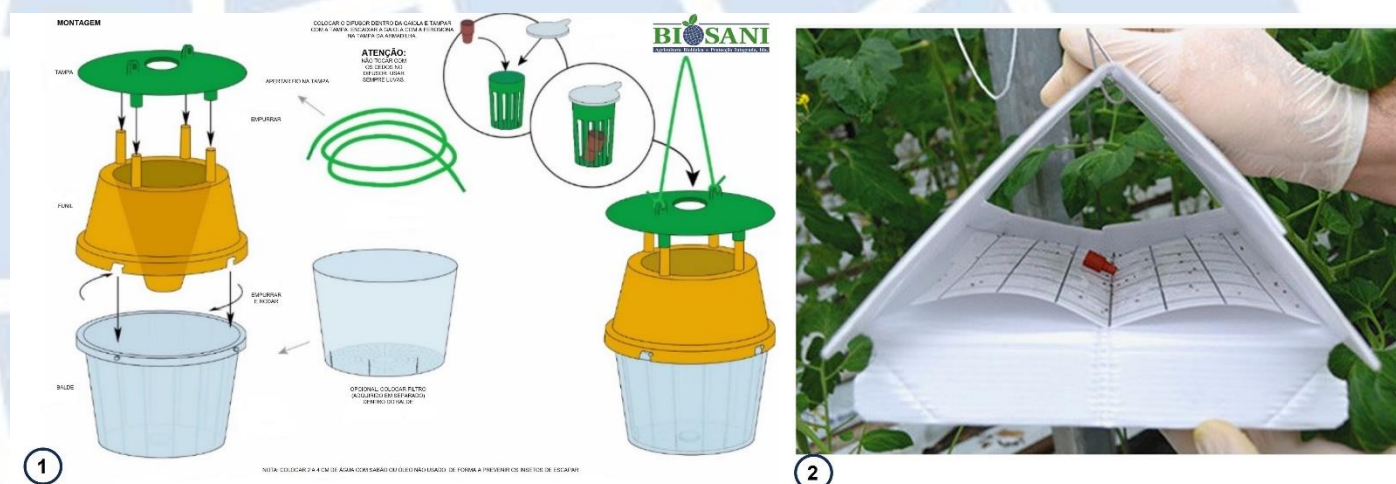
Figura 11.1 - Instruções de montagem do difusor na armadilha de funil (1) e na armadilha delta (2). O tubo de polietileno (Fig. 10.1) deve ser instalado na mesma posição que o difusor de borracha vermelha que se encontra ilustrado na Fig.11.1 (imagem 1 e 2), mas em posição vertical e com a tampa para cima.

11 - Armadilha: Aconselha-se o uso da armadilha de funil (ver figura 11.1) ou delta (ver figura 11.2) para a captura deste inseto. Instalar as armadilhas na cultura, à altura onde se espera que o inseto atue. A armadilha de funil aconselhada é a com tampa verde, funil amarelo e copo transparente, no entanto, poderá utilizar outras combinações. Alertamos que o amarelo poderá atrair abelhas.